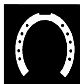
Mitbenutzung von Wanderwegen

Solche mitnutzbare Wege müssen durch folgendes Zeichen gekennzeichnet sein: (Schild mit weißem Hufeisen)