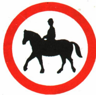
VZ 258: Verbot für Reiter

Das Reiten, nicht aber das Führen von Pferden, kann durch Verkehrszeichen (VZ) 250 mit entsprechendem Reitersymbol (VZ 258) überall dort, wo es erforderlich ist, verboten werden.